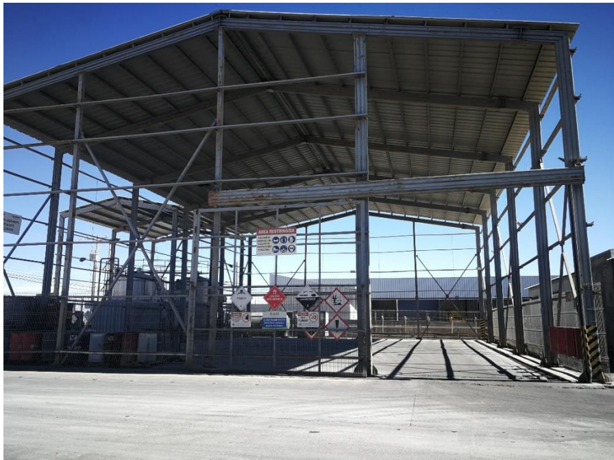
Foto 5. Bodega de SUSPEL.

En el Anexo 3.2 se adjuntan las facturas de los costos incurridos en la construcción de la Bodega de SUSPEL.