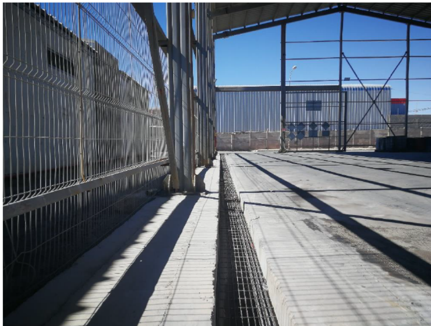
Foto 3. Rejillas en Bodega SUSPEL.

En el Anexo 3.1 se adjunta la factura y O/C del trabajo realizado de instalación de las rejillas, cuyo monto asciende a $4.542.216, aunque la factura incluye costos de otros servicios, en la O/C se discriminan los costos.