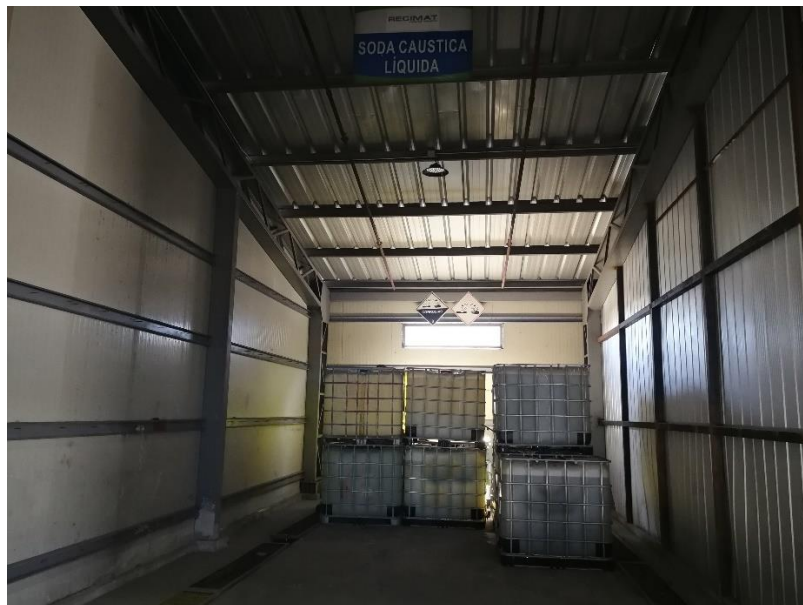
Foto 2. Rejilla en Bodega SUSPEL RECIMAT.