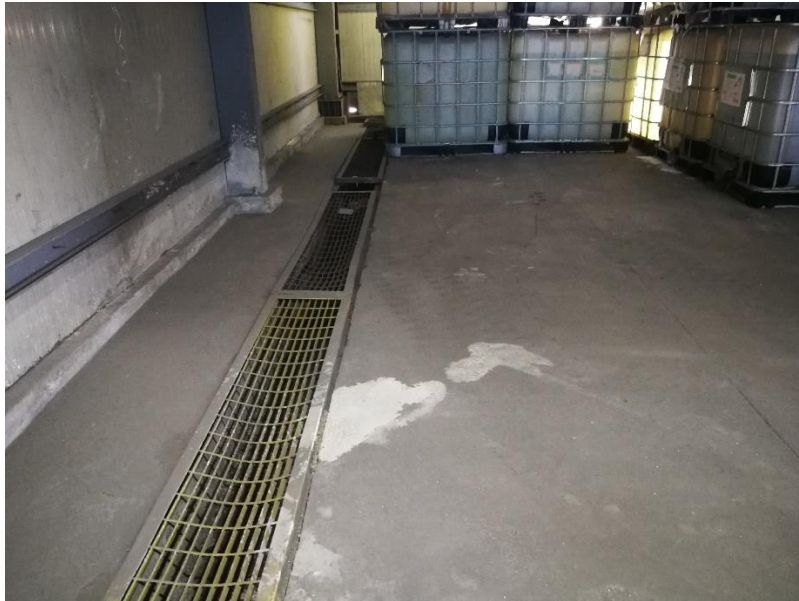
Foto 1. Rejilla en Bodega SUSPEL RECIMAT.

Las rejillas comprometidas en la RCA N° 104/2007, Cons.3.1.5.3 Patio de almacenamiento, se habilitaron antes de la aprobación del PdC, para lo cual se muestran las siguientes imágenes referencias, sin perjuicio de lo comprometido en la Acción 6 del presente PdC Refundido.